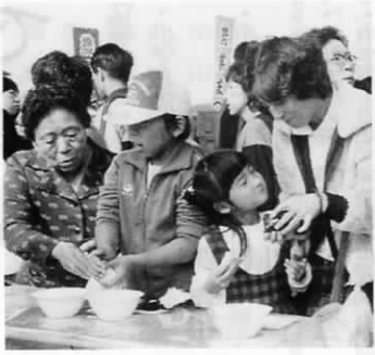
母と子のおにぎりコーナーで