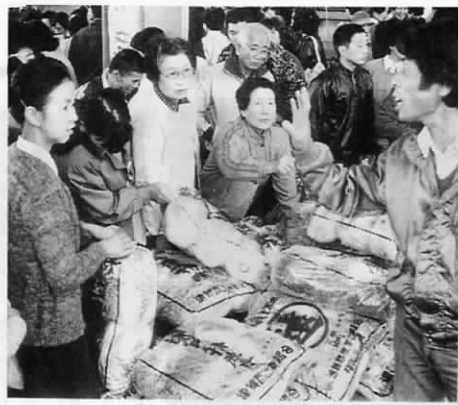
新鮮な野菜に人がき

「緑のふるさと、村づくり、守ろう健康、米と魚」をテーマにした、第二十一回遠賀郡農業祭が、十一月十六日昨年より二万人多い四万人を集めて、芦屋पोर्टレース会場を開かれま