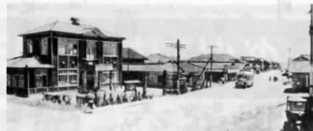
昭和30年頃の遠賀村役場付近(現在の商工会付近)

かねてから編纂が進められていた「遠賀町誌」が、来年一月に出版の運びとなり、遠賀町教育委員会では、 もに生きてきた遠賀町の姿を、あますところなく収録したこの一冊。ぜひご購入を。