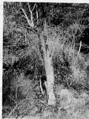
肥 後 守 臣 の 墓

昔から多くのひとびとが、それぞれ の道を、それぞれの目的のために辿つ たのであろう、などと考えてみる。 白菜を積んだ小型車が、横の道を通 りすぎてゆく。(片山花御史)