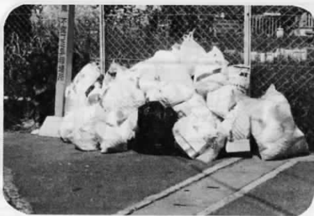
ゴミ出しは決められた場所できちんと出しましょう。

一方、スチール(鉄)カンは、電炉工場で鉄筋や鉄板となって、ビルや船に新しく生まれ変わります。このように空きカンは貴重な資源——うまく再生利用すれば、資源やエネルギーを大幅に節約できるのです。ゴミにするもしないもあなた次第——。「使い捨て」という言葉にまどわされることなく、空きカンは必ず決められた場所に捨てるようにしましょう。