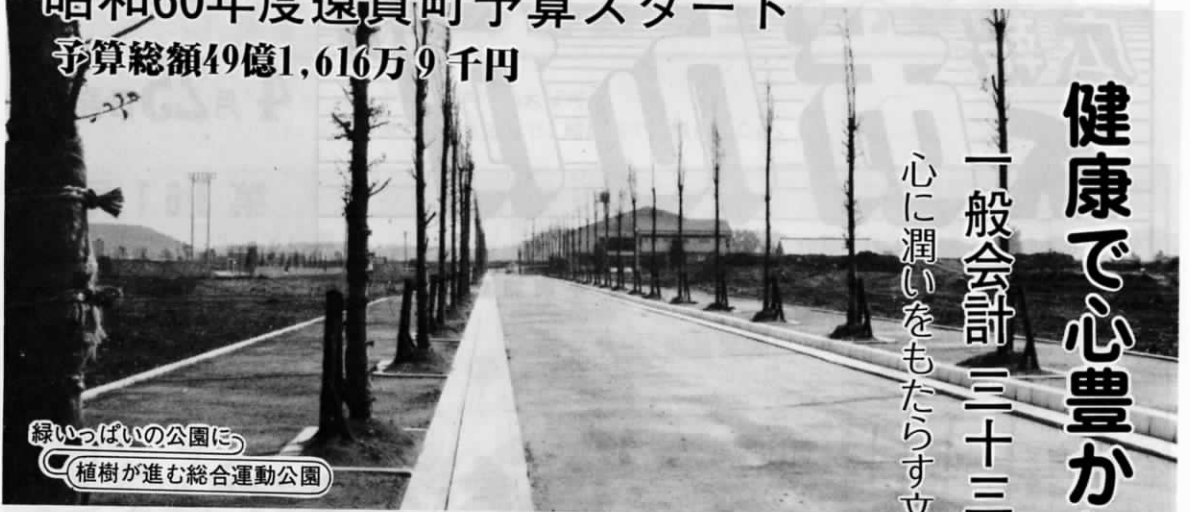
緑いっぱい公園に 植樹が進む総合運動公園