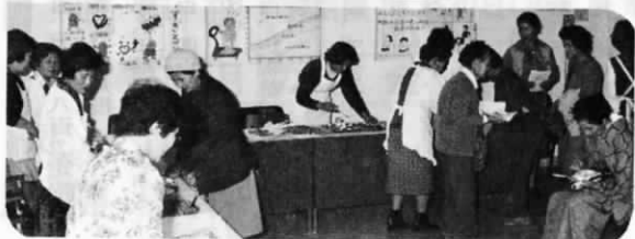
食生活改善推進会による料理の試食と展示