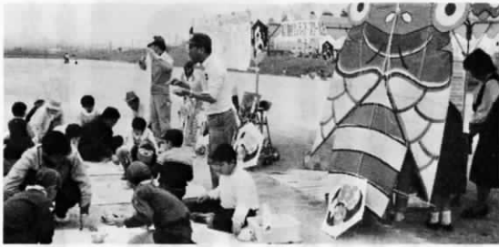
写真は昨年の第2回子ども祭り

遠賀町春祭りとして、「第3回遠賀町子ども祭り」を、全町挙げて盛大に開催します。 みなさんの多数の参加をお待ちしています。 ▽日時 5月5日(子供の日) 10時~15時 ▽場所 遠賀総合運動公園 ▽主催 「子ども祭り」実行委員会 ▽内容 ・午前：ファミリースポーツ