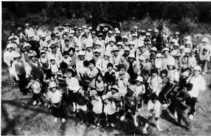
写真は昨年の第6回町民ハイキング