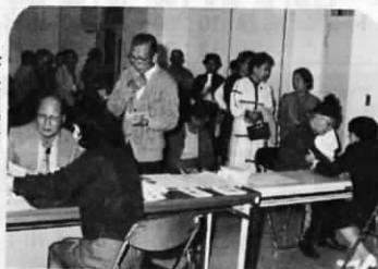
血圧測定と健康相談