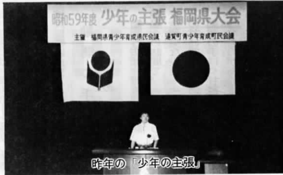
昨年の「少年の主張」