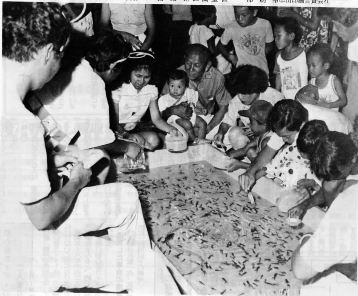
夏まつりにて 8月18日