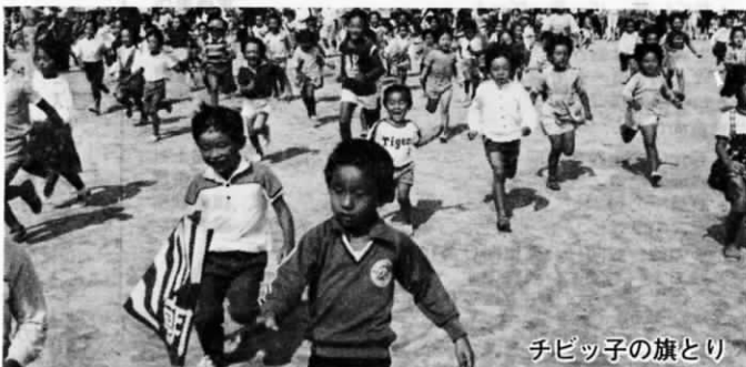
ちびっ子の旗とり