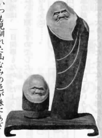
〈彫刻〉 境 貢