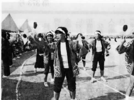
年々応援も華やかに