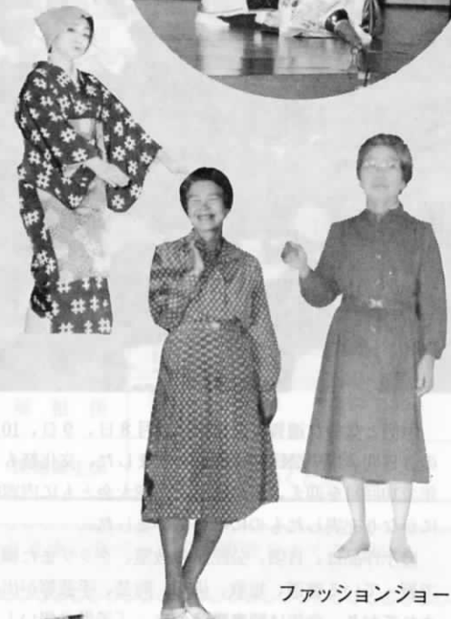
ファッションショー