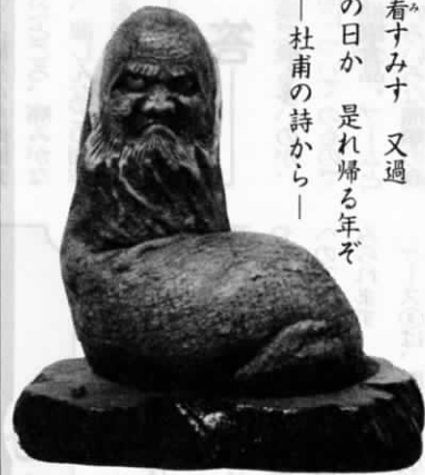
〈彫刻〉 境 貢

江は碧にして 鳥はいよいよ白く 山は青くして 花は燃えんと欲 今春看すみす 又過 何れの日か 是れ帰る年ぞ — 杜甫の詩から —