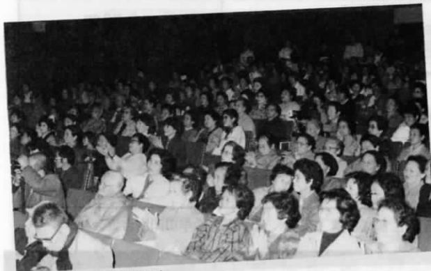
芸能大会の観客500人