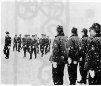
今年の出初式 — 遠賀町にて —