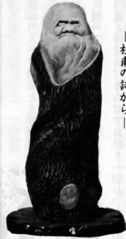
〈彫刻〉 境 貢

朝より回りて日日 春衣を典し 毎日江頭 酔を尽して帰る 酒債尋常 行く処に有り 人生七十 古来稀なり — 杜甫の詩から —