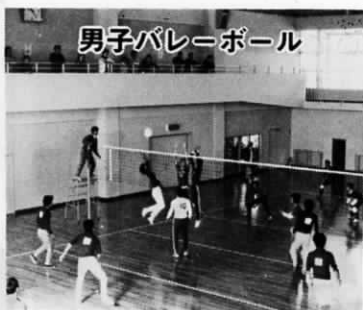
男子バレーボール

▽男子バレーボール、女子バレーボール、軟式野球の……△ △……各競技が開かれます。町民のみならず多数の参加と応……△ △……援をお願いします。写真は昨年第一回各競技。……△