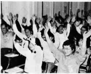
60名のボランティアが集ったボランティア・スクール