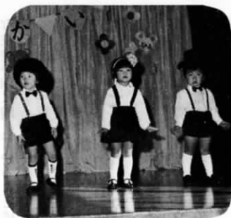
昨年11月のおゆうぎ会

山びこ保育園では、昭和59年度の定員に余裕がありますので、入所を希望される方は、同保育園か役場福祉係にお申込みください。