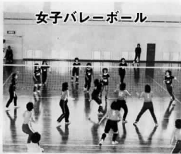
女子バレーボール