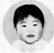
東町 (虫生津389番地の121)

私、身体は小さいけれど、とても元気な女の子です。家にいるとよく泣きますが、外に遊びに行くと笑顔になります。病気をしないで元気に育てと、パパやママはいいです。