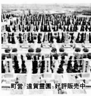
町営 遠賀霊園 好評販売中