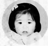
東和苑 (浅木620番地の70)