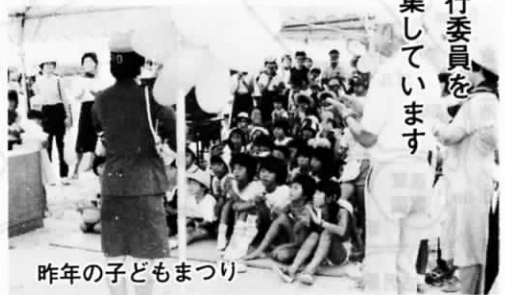
昨年の子どもまつり