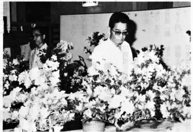
赤や白、紋りなどの名花、名木約100点が展示されました

6月1日から3日まで中央公民館でサツキ愛好会の主催によるサツキ盆栽展が開かれ、多くの来訪者の目を楽ませてくださいました。