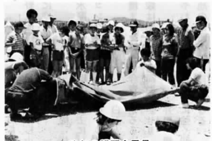
昨年の講習会風景