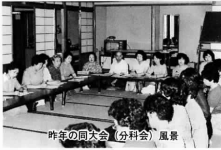
昨年同大会(分科会)風景

「健全な家庭づくりのための学習と実践活動の在り方を考える」をテーマに、子ども会育成会、婦人会、母子会、老人クラブ連合会、各小中学校 P・T・A の参加を得て、広く、青少年健全育成のための婦人リーダーの役割りを討議し、実生活での実践を目的として開催します。