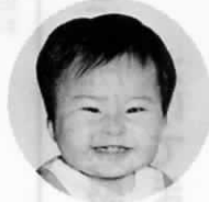
松ノ本(今古賀789番地の76)

私には、お兄ちゃんが二人います。毎日、ハイハイしながら部屋の中をウロウロして、お兄ちゃんと同じことをするので、パパやママは、ワンパクぶりに苦労しているようです。