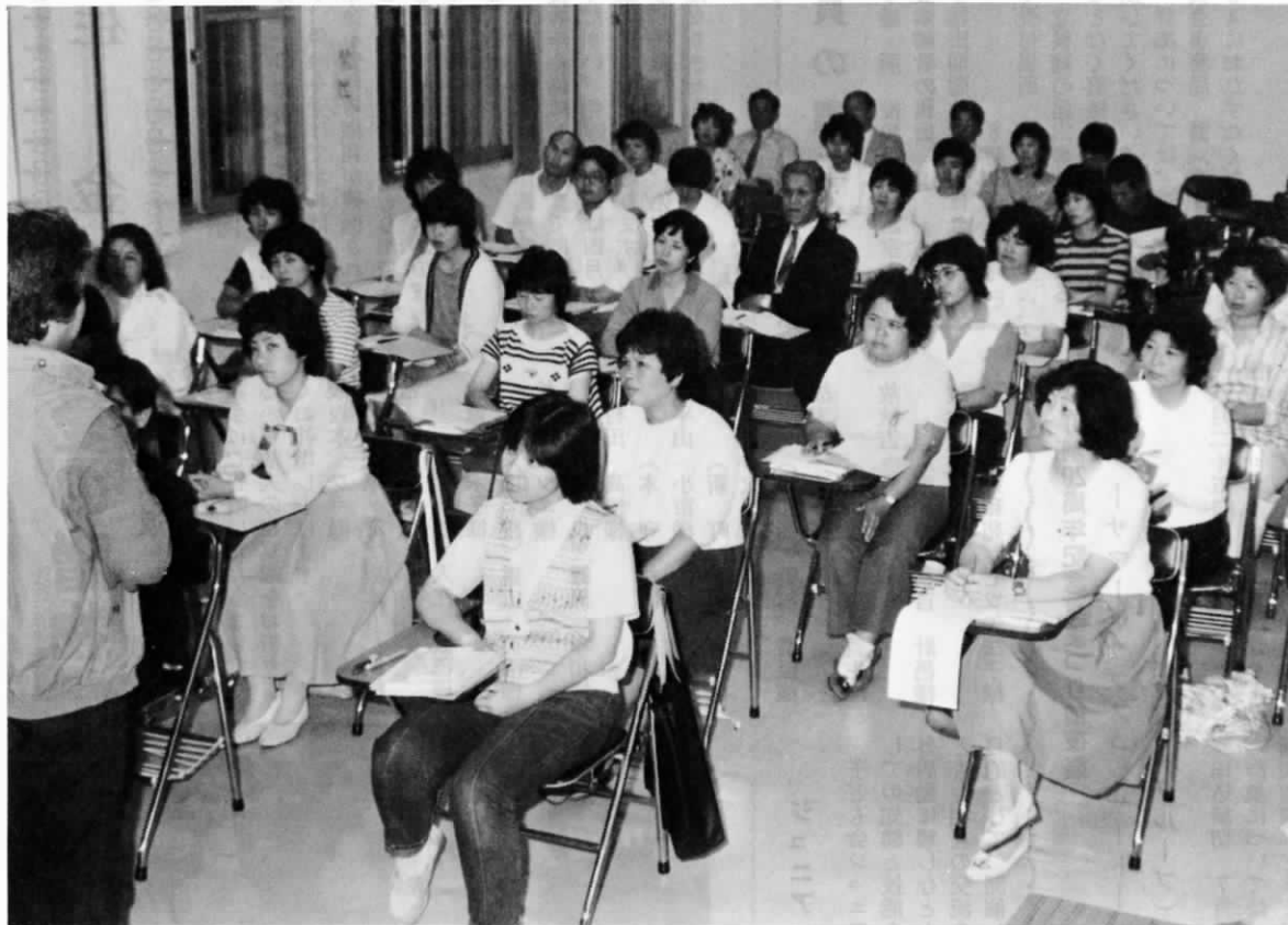
第2期ボランティア・スクール開講