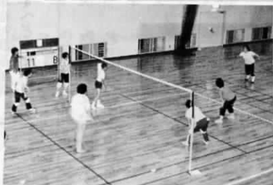
インディアカ教室

先月、勤労者体育センターでインディアカ教室(二回コース)と、卓球教室(四回コース)がそれぞれ開かれ、多くの受講生が集まりました。