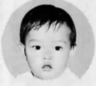
若葉台(上別府17番地の2)

わたし、パパ似で名札はいらないって…(パパ、ニンマリ)。ちよっぴり小粒ですが、なんでもできるんですよ。だっこが好きな甘えん坊ですが、お友達になってね。