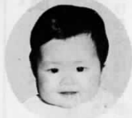
遠賀川(今古賀21番地の8)