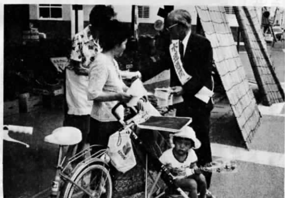
六月四日、遠賀川駅前周 辺で町長や水道局関係者が 水道週間の呼びかけを行った