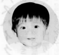
遠賀川 (今古賀103番地の8)

ボク「色黒さん」で言われるけど、愛嬌はとってもいいんだよ。ハイハイだって上手なんだ！早く歩けるようになってお兄ちゃんと一緒に外で遊びたいなあ。