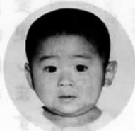
松ノ本 (今古賀789番地の43)