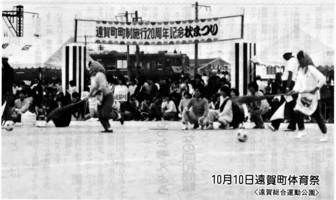
10月10日遠賀町体育祭 〈遠賀総合運動公園〉