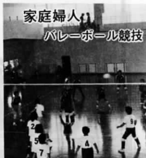
家庭婦人バレーボール競技