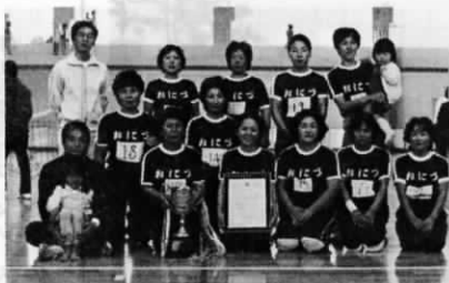
優勝の鬼津チーム