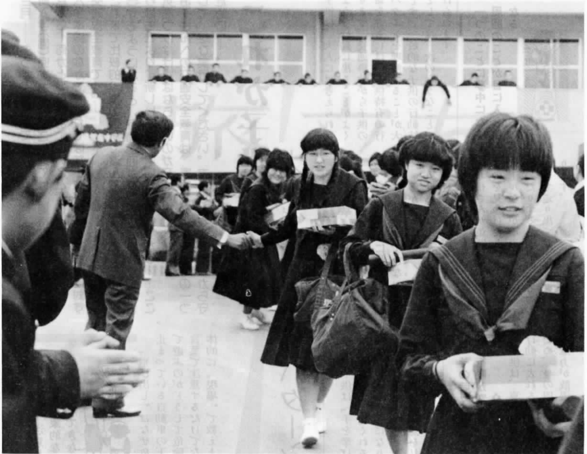
さまざまな思い出を胸に 今日巣立ち