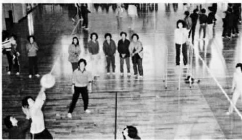
写真は婦人会ビーチボールバレー大会