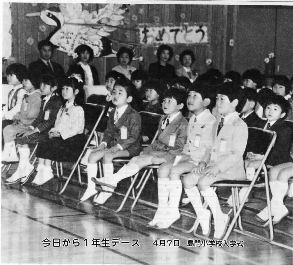
今日から1年生デース 4月7日 島門小学校入学式