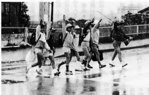
島小前で4月16日撮影

今年も5月10日から20日までの十日間、「春の全国交通安全運動」が実施されます。多発する事故の特徴をふまえて、次の三項目を重点に運動が展開されます。