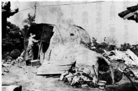
別府瓦工場最後の瓦焼き