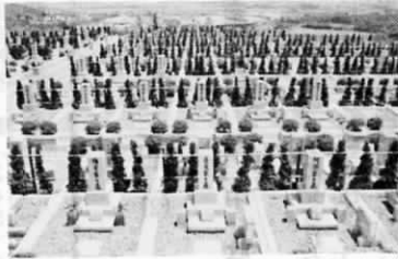
町営“遠賀霊園好評販売中” お問合せは、遠賀霊園事務所 ☎(293)2397へどうぞ。