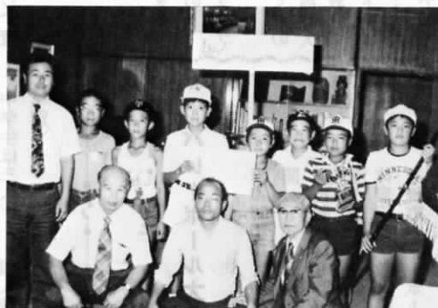
9月21日 町長、教育長に優勝の報告に来ました ——町長室にて——

本大会には、十六チームが各地区の代表として参加予選から絶対調の遠賀リトルシヤークスは、決勝戦で水巻町の強豪上二チームを六対一で破り見事初優勝。青少年の非行防止はソフトボールからと、島門小学校区の児童を集め三年前に同チームを結成。仕事の合間をみては子供達にソフトボールの指導をしている森監督(別府)は、「子供達はチームワークを大事にして、日