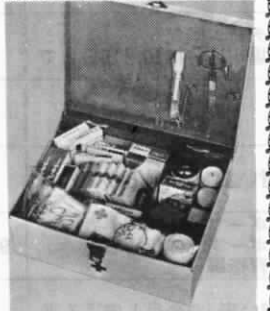
薬箱は子供の手の届かないところに保管しましょう

薬は湿気、光、熱によって影響を受けやすいものが多いですから、せんを固くし、直射日光の当たらないところに保管しましょう