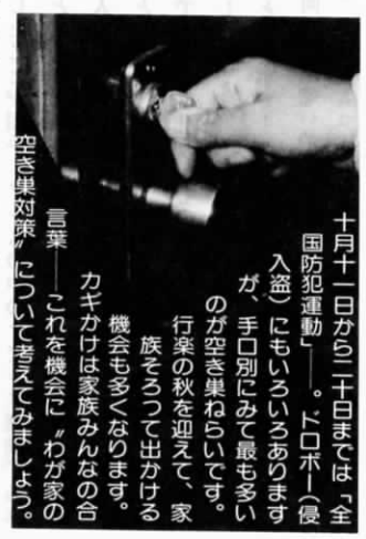
空き巣対策について考えてみましょう。

カギをかけたかどうかもう一度確認を！ 空き巣ねらひの被害のうち約四割は、カギをかけたところから侵入されています。玄関や勝手口ばかりでなく、応接間をはじめ浴室の窓、トイレの高窓や二階の窓もよくねらわれます。「まさかこんなところから……」といった勝手な思い込みは禁物です。出かける前には必ず見回り、カギはかけたか、戸締まりは大丈夫か、もう一度確認を。 玄関にはCPマーク つきのカギを このCPマークは、警察庁の厳しい検査に合格し、優良防犯機器として認定されたカギにだけつけられるものですから、安心して取りつけられます。 「ちょっとの留守」でも必ず戸締まりを 空き巣ねらひは、家に侵入して 十月十一日から二十日までは「全国防犯運動」。下口(侵入盗)にもいろいろあります。が、手口別にみて最も多いのが空き巣ねらひです。行楽の秋を迎えて、家族そろって出かける機会も多くなります。カギかけは家族みんなの合言葉。これを機会に、わが家の 四、五分もあれば「ひと仕事」を終えるといわれるほど素早い犯罪です。短時間の外出でも必ず戸締まりを。空き巣ねらひの被害の約四分の一は、買物などで留守になりがちな午後二時から四時の間に発生しています。 新聞や牛乳を外に ためないように 洗濯物が出しっぱなしだったり新聞や牛乳が新聞受けなどにたまっているのは、留守であることを告げているようなものです。一日以上家を空けるときは、配達を断るか、取り片づけを近所に頼んでおきましょう。