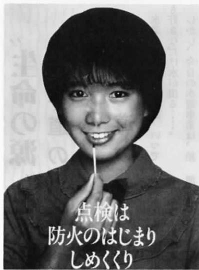
点検は防火のはじめ しめくくり

冬場は、どうしても揚げ物やいため物など、油を使った料理が多くなります。また、12月は、特に