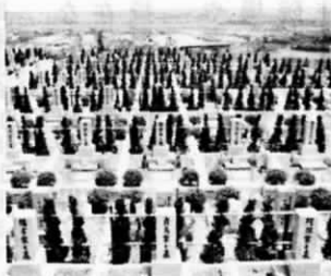
—町営・遠賀霊園・好評販売中—

▽届出先 大分市中島西3丁目5番1号 (佛)佐迫建設敷戸宅地開 発事務局 電話0975(36)1530 ▽届出期限 昭和58年12月31日