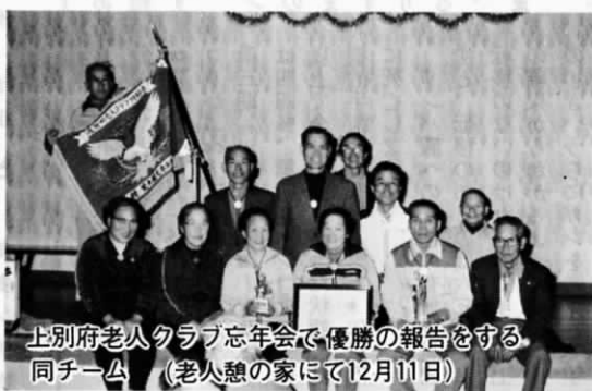
上別府老人クラブ忘年会で優勝の報告をする同チーム (老人憩の家にて12月11日)

大接戦の末上別府チームが優勝し二位は新町でした。優勝旗、トロフィー、メダルを授与され参加者全員の祝福を受けました。