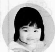
松ノ本(今古賀704番地の123)

僕は泣きべそで甘えっ子。その上いたずら好き。近頃僕が泣いてもみんな知らん顔するんだよ。でも、パパとおじいちゃんは甘いから、味方につければ我家は僕の天下だよ。