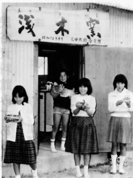
児童達も、出来の良さに思わずニッコリ

古くなった重油窯にかわってPTAが廃品回収して購入した新しい電気窯を使ったとあって、くろうとはだしの豆陶芸家達の瞳も期待に輝いています。