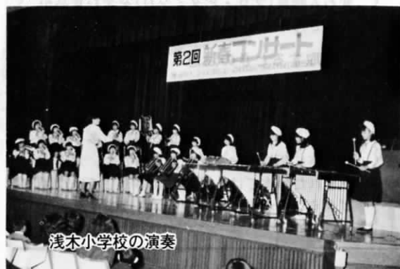
浅木小学校の演奏

1月8日、遠賀郡青少年少女合唱団とジュニア吹奏楽団の発表会を兼ねた「第2回新春コンサート」が中央公民館でありました。当日は、青少年少女合唱団が「花のまわりで」など8曲、ジュニア吹奏楽団が「若者たち」など10曲をひろうしたほか、浅木小器楽クラブ、島門小6年生、広渡小吹奏楽団、女声コーラス「こもれび」が出演して、会場に集まった約600人の観客を魅了しました。