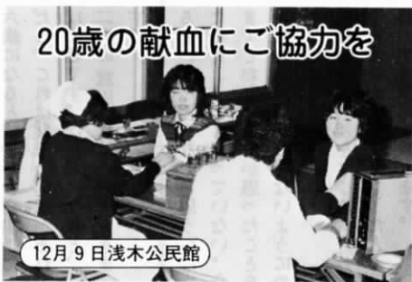
20歳の献血にご協力を