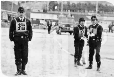
「おみごと」 遠賀町消防団 ポンプ車操法をひろう