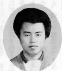
新町 学生 安部 政治

成人式を迎えるにあたって、これから展開する二十代という年代が、長い人生の最後の準備期間であるとともに、人間形成の上で大切な時期であるということ