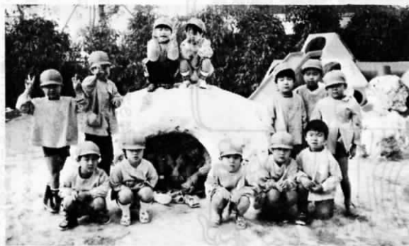
「みんなで作ったんだ」 りっぱなまくらが完成 —1月19日 南部保育園—