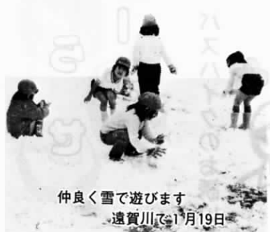
仲良く雪で遊びます 遠賀川で1月19日

警察や学校からの連絡でわが子の非行を知り「うちの子に限って……」と絶句する親が多いといわれます。 子供は、ある日突然、非行に走るわけではありません。病気に潜伏期間があるように、非行という心の病にも「前ふれ」があります。 ふだんから子供の生活を注意深く見守りながら、非行の芽を早い時期に摘みとってしまうことが大切です。 子供のどういう行動が非行につながっていくのか、その「兆し」のいくつかを挙げてみました。 ○学校の成績が急に落ちる