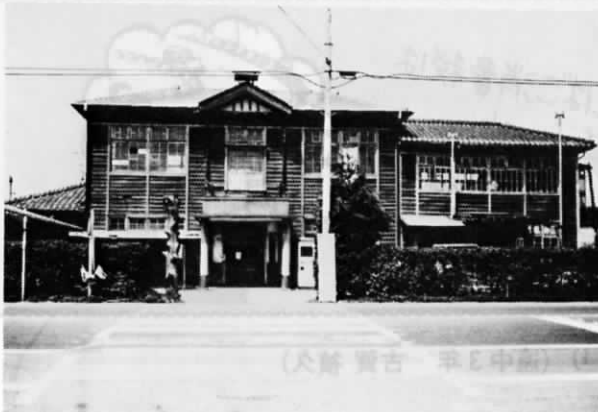
旧遠賀町役場庁舎 昭和47年頃撮影

を迎えます。五十周年記念行事に使用する「遠賀町簡易水道時代の写真をお持ちの方はご連絡ください。 ▽連絡先 遠賀町役場内中間水道 遠賀出張所