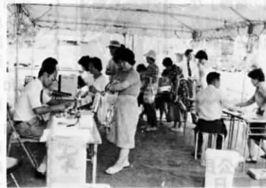
昨年9月の献血<農協前にて>