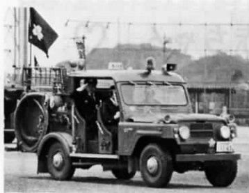
消防自動車<今年の出初式にて>

現在では、消防態勢も常設消防署の設置により、消火活動も迅速になったが、反面火の廻りも早くなってきた。これは新建材の使用によるものであるが、このため、燃焼による有毒ガスの発生により、燃死者が多くなったことは遺憾なことである。お互いに火の取扱いには充分注意しなければならぬ。そこで消防の生い立ちをふりかってみよう。 (古野千年)