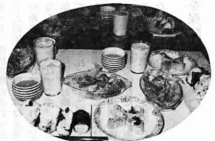
できあがりしました