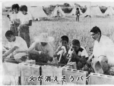
火が消えそうバイ

7月31日、昼過ぎ全員集合。速賀町レクリエーション研究会の指導の下に、夏の太陽の照りつける中、まずは、テント設営。さて、お次は飯合炊飯。メニューはカレーライスで、各自役割を分担しての御飯の仕度。自分達の食べる御飯を自分で作るというキャンプならではの醍醐味を満喫して