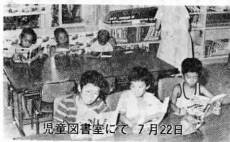
児童図書室にて 7月22日

7月21日、児童図書室開きがありました。当日「紙しばい」をしました。右の写真のように多くのちびっ子が観賞し、テレビとは違った素朴な画面に人気が集まっています。