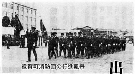
遠賀町消防団の行進風景