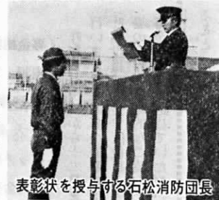
表彰状を授与する石松消防団長