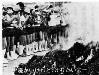
「暖かいけれど、けむりたいよー」

広渡小学校では、1月17日児童達が家庭から持ち寄ったお正月の松かさりや書きぞめを焼く、恒例のどんど焼をしました。 同校では、約六百年前から始まったといわれるこの日本の心を、子供達に受け継がせていきたいという考えから始めたもので、児童達は、この灰を健康や成績があがるようにとおまもりがわりに持って帰りました。