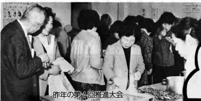
昨年の第4回推進大会