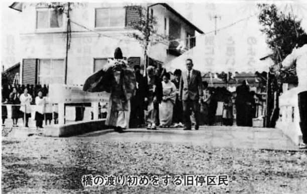
橋の渡り初めをする旧停区民