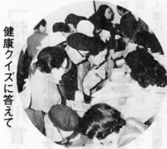
健康クイズに答えて