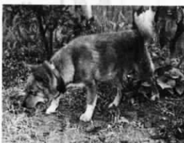
「ワンちゃん…… 鎖はどうしたの?」

犬は、法律により春と秋に「狂犬病予防注射」を受けることが義務づけられています。狂犬病にかかった人間、犬は現代医学でも全く治療の方法がなく、患者は死を待つだけの、たいへん恐ろしい病気です。愛犬には必ず予防注射を受けさせましょう。