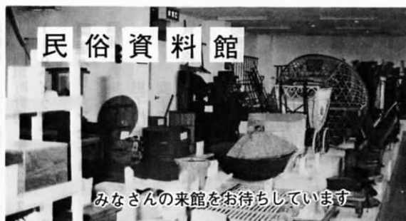
みなさんの来館をお待ちしています