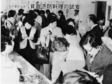
貧血予防料理の試食