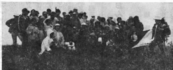
犬 ヶ 岳 山 頂 で

当日は、あいにくの雨模様でしたが、3歳の幼児から82歳のお年寄りまで参加者135名、元気よく頂上をきわめ、時折雲間から頂く展望を楽しみました。今後は毎年催す予定ですので、よりいっそう町民の方々の参加を願います。