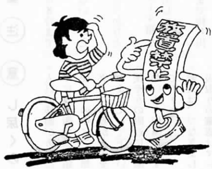
●自転車は、きめられた場所にきちんと駐車する