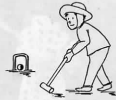
町内高齢者の親睦をはかることが目的です。