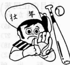
町内成人者の親睦をはかることが目的です。