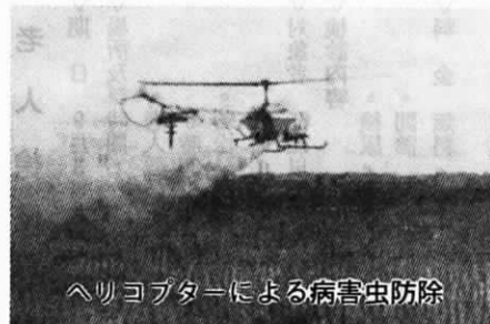
ヘリコプターによる病害虫防除

当町では昭和36年7月九州他市町村にさががけ、初のヘリコプターによる防除を実施し、他の注目を浴びたが諸種の事情により、現在では共同防除や各個防除に努め