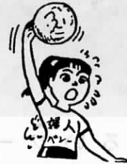
町内既婚女性の親睦をはかることが目的です。