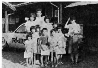
(浅木公民館にて撮影)

夏休みの8月5日、浅木区の若宮民謡教室子供部にRK Bのスナッピーが取材にきました。朝の番組のわずか5分間ほどでしたが、8人の会員は緊張しつつ「こきりこ節」を披露しました。