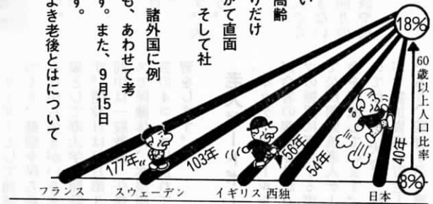
かけ足でやってくる高齢者社会 (人口高齢化の国際比較) (資料) 総理府「高齢者問題の現状」

同時に、わが人口の高齢化は、諸外国に例を見ないテンポと規模で進むことも、あわせて考えておかなければならない問題です。また、9月15日から一週間は「老人福祉週間」です。人生に定年なし——この機会によき老後とはについて考えてみました。