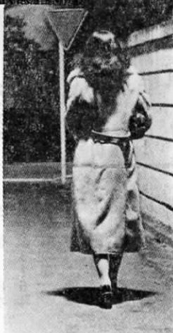
ハンドバックはかかえ るように持ちましょう