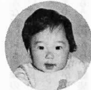
東和苑(浅木1174番地の22)

僕にアダナがつきました。「カメンライダーみたい」と僕の頭をみて近所のお兄ちゃんが喜びます。本当に僕は強そうかな...?。今、ハイハイに無中で、はいまわって探検するのが楽しみです。