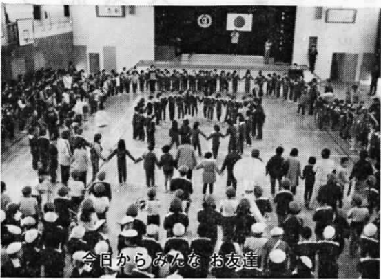
今日からみんな お友達