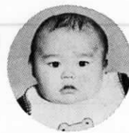
東和苑(浅木617番地の14)

僕、お父さんとお風呂に入るのが大好き。だって男同志の話しができるから。今では、元気いっぱい、いたずら僕だけど、お父さん、お母さんよろしくお願ひします。