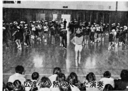
広渡小の熱の入った演奏