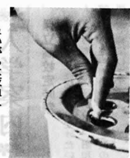
吸いがらは灰皿へ……

これは、ストーブが家財道具の集中した部屋で使われるためといえますが、最大の原因は火災が起こった場合の炎が大きく、初期消火が難しいという点にあります。ストーブは私達に「ぬくもり」を与えると同時に、財産や生命を奪うこととなる危険性も秘めています。