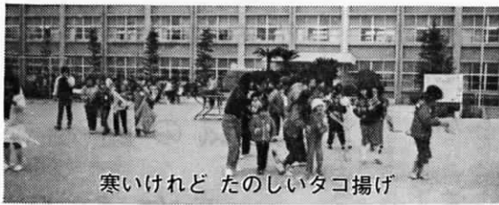
寒いけれど たのしいタコ揚げ

小雪がちらつく天候の中、校庭を力いっぱい走り回ってタコ揚げをした後、体育館で交歓音楽会を行いました。同年代の他校児童と接する機会のない養護学校生徒達は、広渡小学校児童の熱の入った吹奏楽隊、鼓笛隊の演奏、そしてチアガールの踊りに盛んな拍手を送っていました。