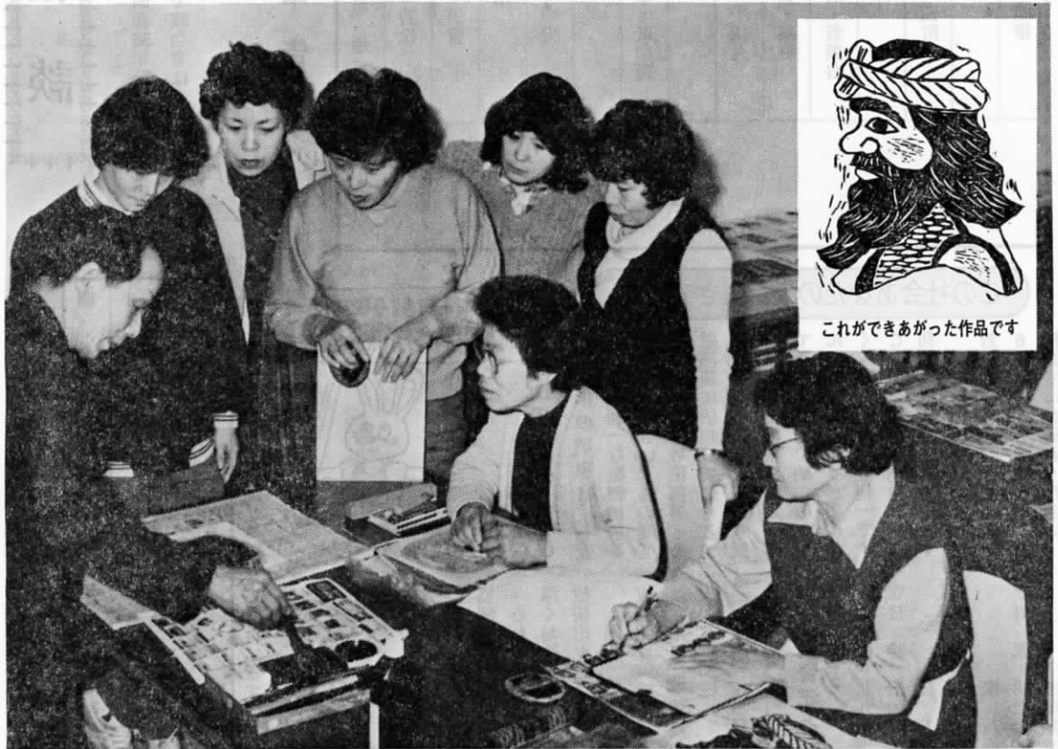
これのできあがった作品です