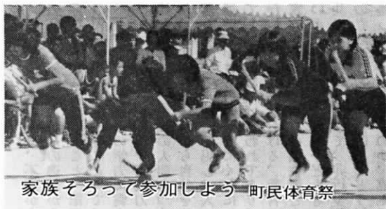
家族そろって参加しよう町民体育祭