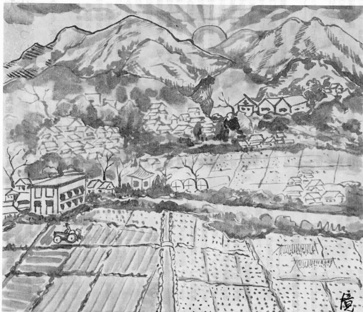
遠賀町の風景 (その11) 今古賀の田畑

昭和55年も20日あまりとなりました。長かったとも、短かったとも思えるこの一年、みなさんはどう思われますか。さて、今回の表紙は、今古賀区を前方に、バックには上別府から尾崎にかけての山をもってきました。一年が終わるように、静かに夕陽は沈みます。