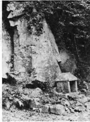
祭神は大山祇命である。

古月駅 から山手 線を越し て、いつ か行った 権現さま への道に 別れて、 山の中の 道を登っ てゆく。