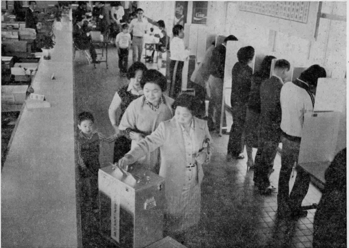
投票につめかけた人たち