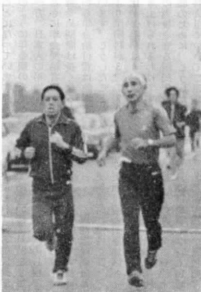
成人病予防はまず運動から