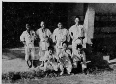
団体優勝した遠賀Aチーム

9月17日、岡垣児童体育館で行なわれた遠賀郡少年柔道大会で、遠賀町柔道教室生は、並い強豪を相手に熱戦を展開し、団体優勝をはじめ、個人優勝など優秀な成績をあげました。大会での成績は次のとおりです。