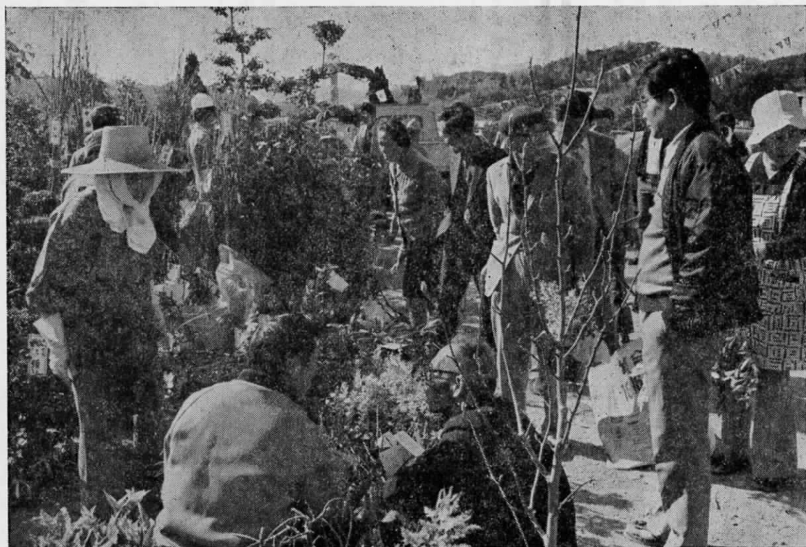
1 本いらんかね (にぎやかに農業祭)