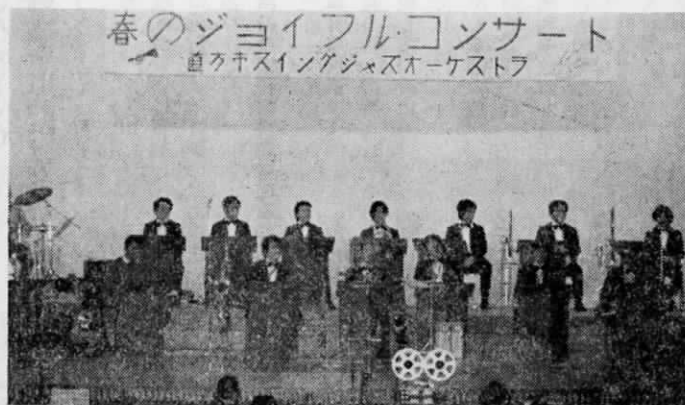
春のジョイフルコンサート 直方キスイングジャズオーケストラ