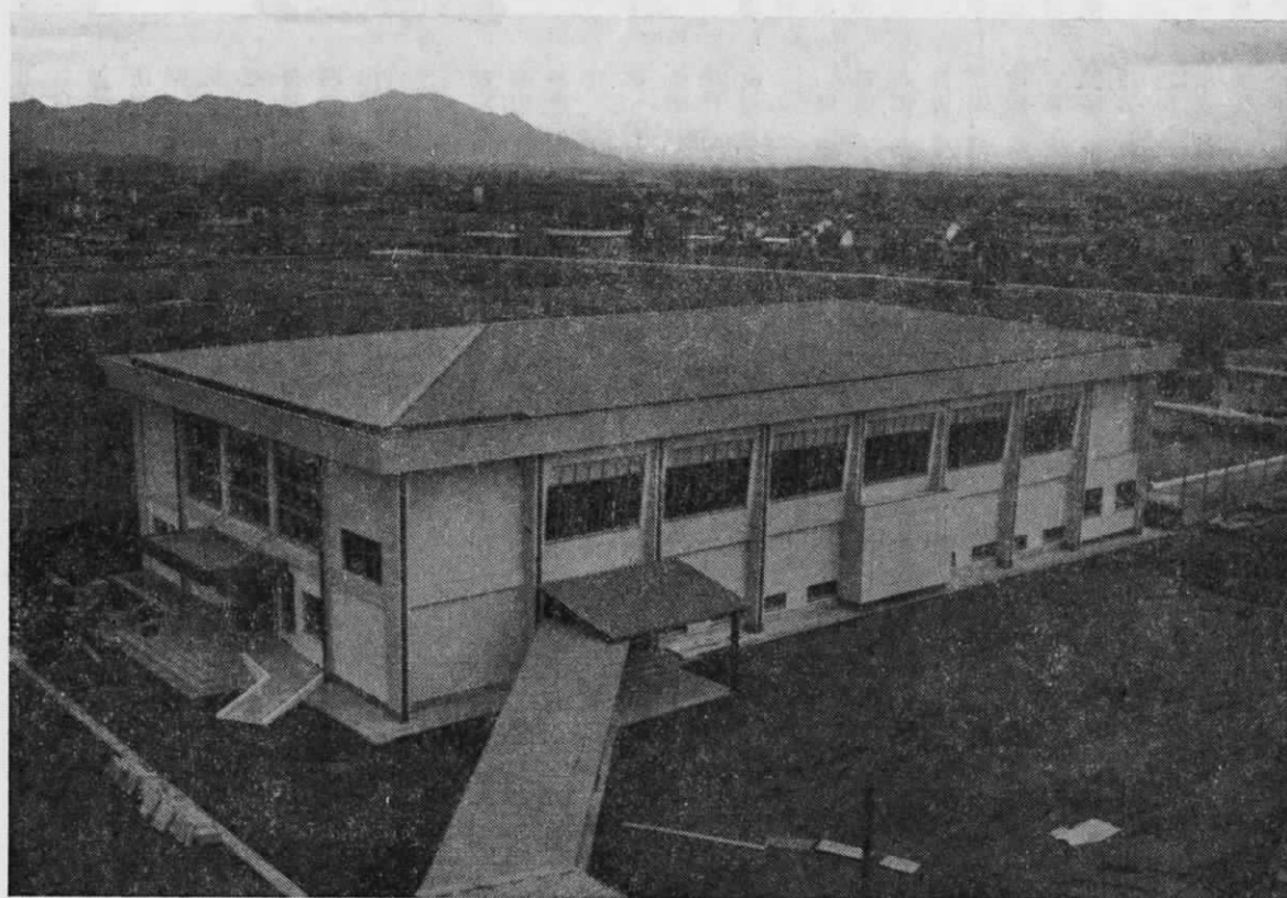
広渡小学校に、待望の体育館完成