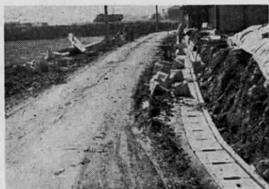
島津一若松線道路舗装工事