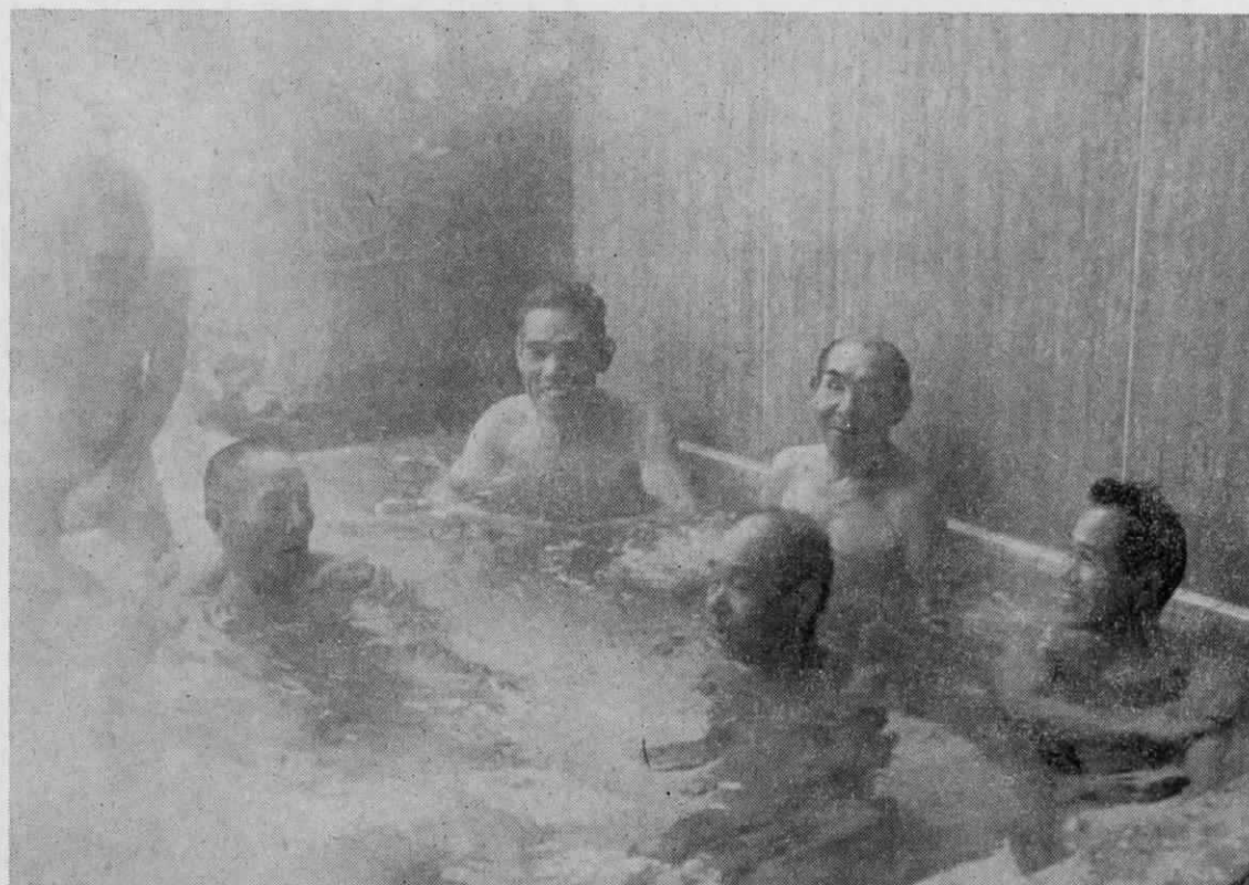
シワも伸びますお湯の中