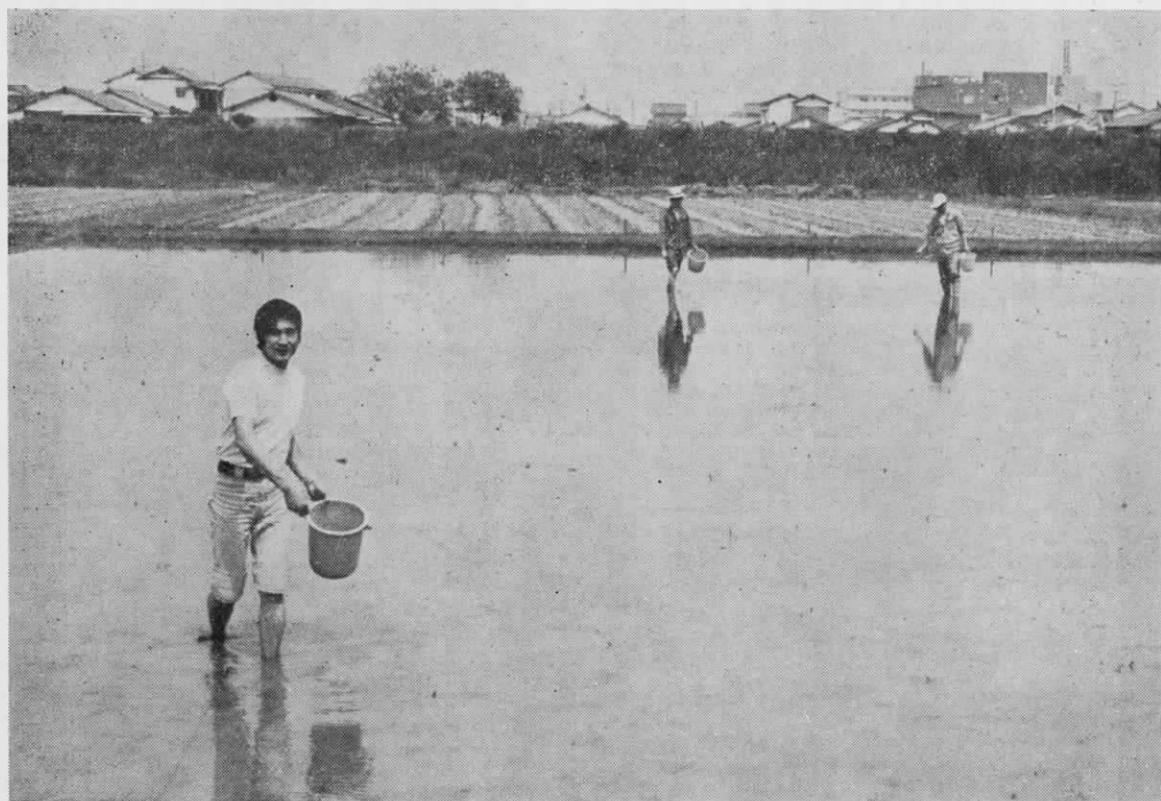
豊作を願って (水稻の直播風景)