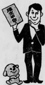
所得税の確定申告と納税

昭和51年分の贈与税の申告と納税は2月1日から、所得税の確定申告と納税は2月16日から、それぞれ受付がはじまります。どちらも申告と納税の期限は3月15日までは、期限間近になりますと税務署の窓口は大変混雑し、落ちついて相談ができません。長い時間待っていただくようなことにもなりますので、申告はできるだけ早く済ませるようにして下さい。