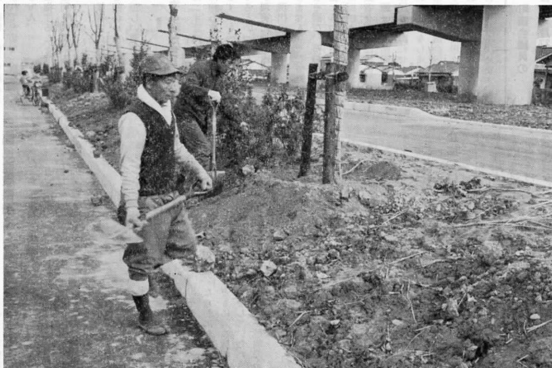
緑化が進む遠賀バイパス付近