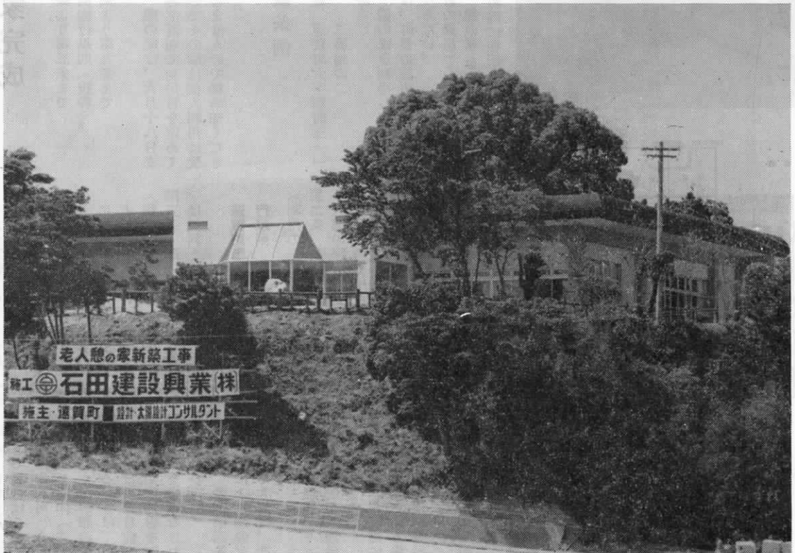
町内別府の高台に完成した遠賀町老人憩の家