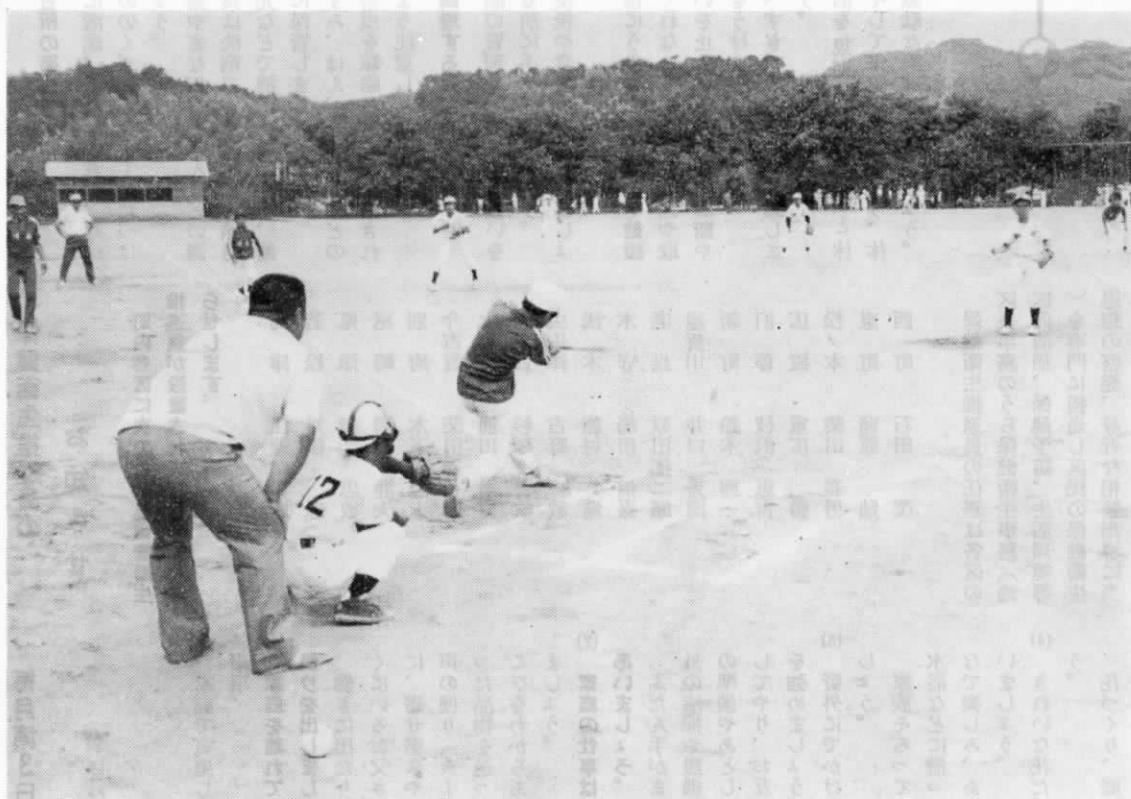
去る7月28日の遠中での少年ソフトボール大会