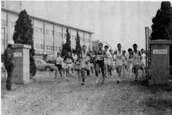
第1回走ろう大会の小・中学生たち