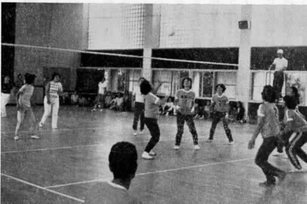
大会で活躍する ママさん バレーボールチーム