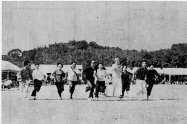
町民体育祭の夫婦仲よしリレー