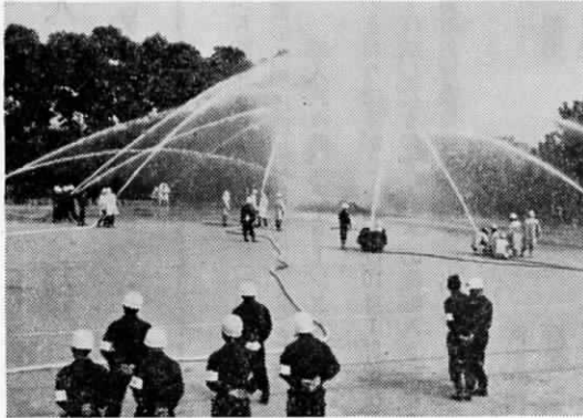
9月30日島門小学校で実施された遠賀郡合同の消防訓練