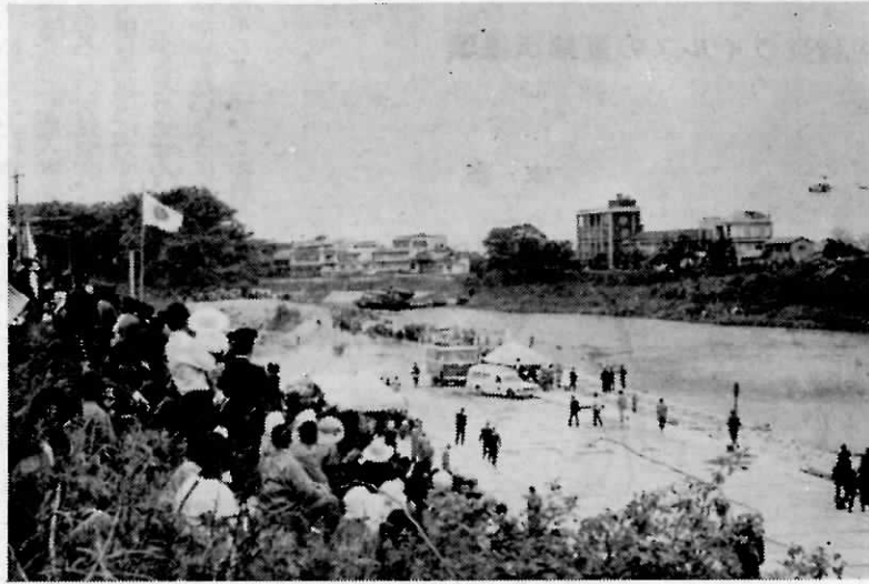
防 災 訓 練 実 況 状 況

去る五月二日午前一〇時から山門郡瀬高町大字長田新船小屋の矢部川に於て、福岡県筑後市瀬高町の主催による福岡県総合防災訓練が実施されました。雨期を目前に控え県下各地から消防団の関係者が多数見学しました。主な訓練種目は水防警戒訓練、救出救護訓練、避難誘導訓練、水防工法訓練その他多くの訓練が行われ参加団体四三団体、参加人員一、三二二 人の多くを数えました。この訓練は毎年実施されており、目的は暴風雨、高潮、洪水等の非常災害に際し、水防救難、救助等の災害応急対策活動を迅速的確に行なうため関係防災機関の協力のもとに総合的な防災訓練を実施し防災体制の確立と防災思想の普及、宣伝を図ることを目的として実施されたのであります。