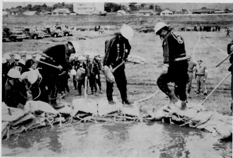
5月28日遠賀川新飯塚下流域で行なわれた県防災総合訓練

「災害は忘れた頃にやってくる」といわれますが、まったく私たちが痛感する言葉であります。遠賀町は東に遠賀川を控え中央に西川が通り、その他数多の河川が町内を流れており、一たび集中豪雨に見舞われると遠賀川を除く一部の河川で氾濫する所があり、現状で は雨期に備えて必ずしも万全とは言えません。国、県町村ではここ十数年来、毎年防災対策がなされてきましたが、山林の濫伐、鉦害による河川の埋没等地理的条件に伴なう危険河川がまだ存在しております。 町においては、万一の災害に対